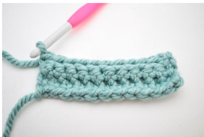
16. Hækl 1 fm i bml rækken ud. (33)