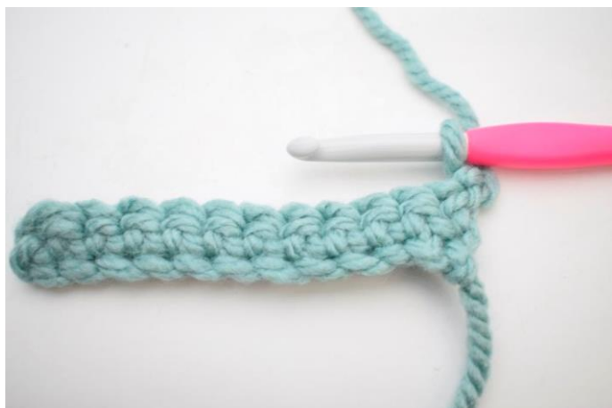
7. Vend med 1 lm.