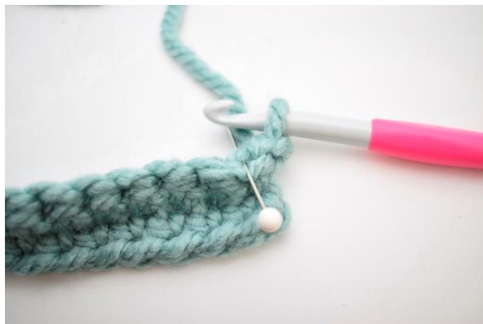
14. Hækl 1 fm i første m i bml.