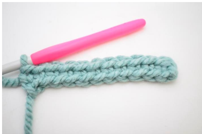
6. Hækl fm rækken ud. (33)