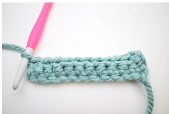
12. Hækl 1 fm i bml rækken ud. (33)