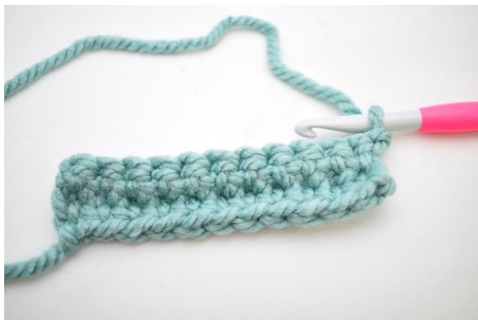
13. Denne række hækles som række 2. Vend med 1 lm.