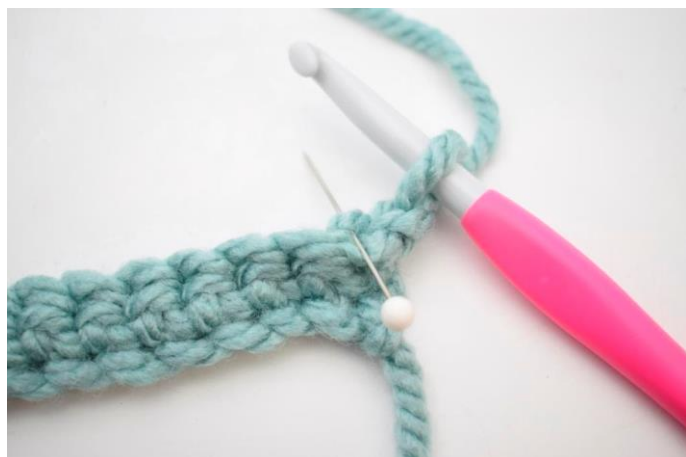
8. Hækl 1 fm i bml rækken ud. Den bagerste lænke er den lænke nålen her viser.