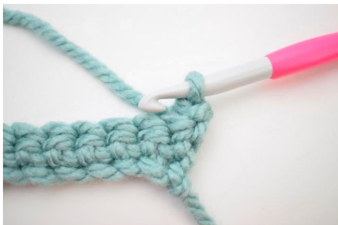
9. Sådan. Der er nu hæklet 1 fm i bml.