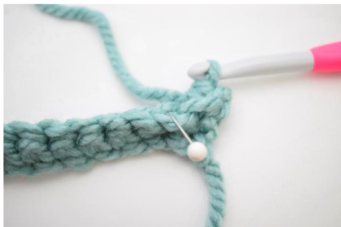
10. Hækl 1 fm i næste m i bml.