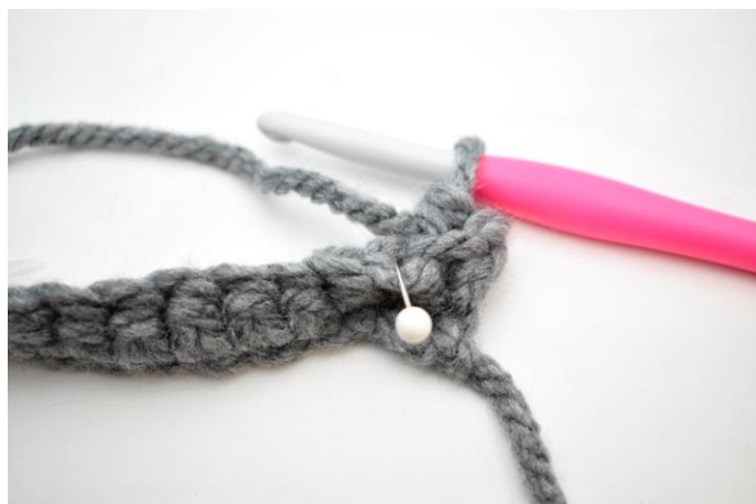
10. Hækl 1 fm i næste m i bml.