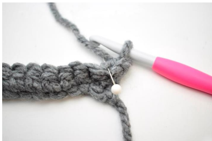
8. Hækl 1 fm i bml rækken ud. Den bagerste lænke er den lænke nålen her viser.