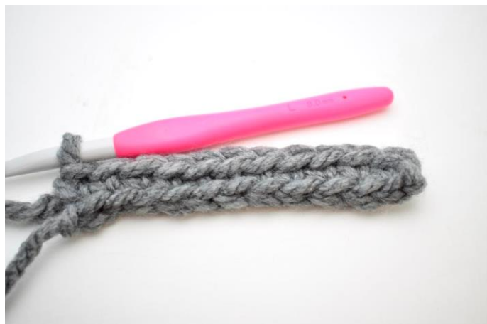
6. Hækl fm rækken ud. (26)