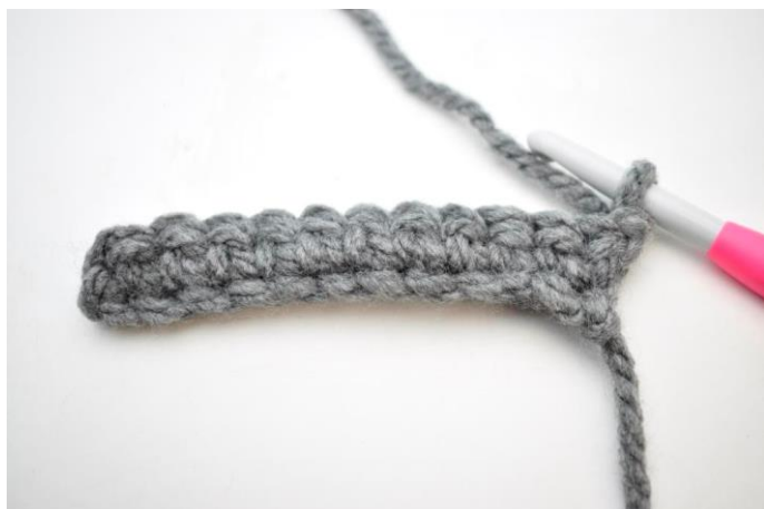
7. Vend med 1 lm.