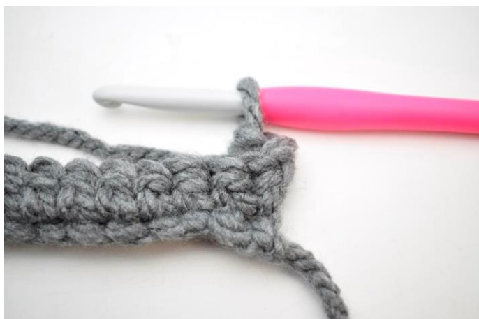
9. Sådan. Der er nu hæklet 1 fm i bml.