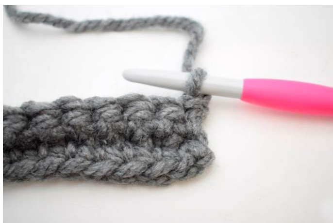
13. Denne række hækles som række 2. Vend med 1 lm.