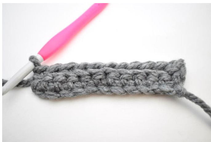
12. Hækl 1 fm i bml rækken ud. (26)