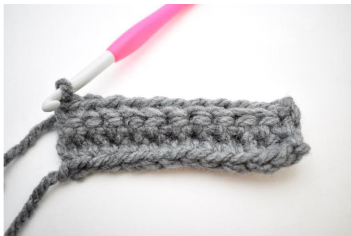
16. Hækl 1 fm i bml rækken ud. (26)