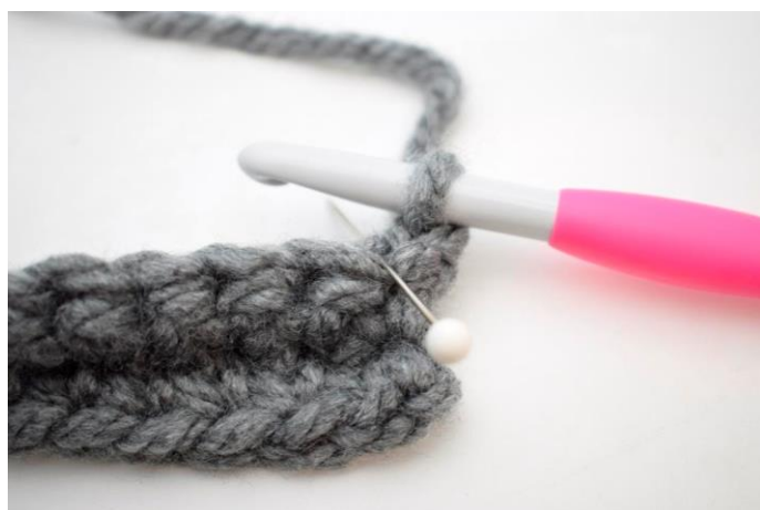
14. Hækl 1 fm i første m i bml.